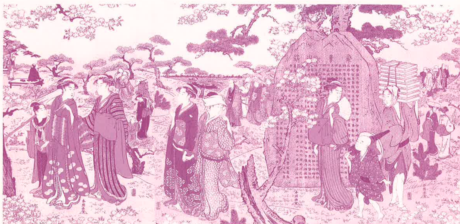
勝川春潮「飛鳥山花見」太田記念美術館蔵