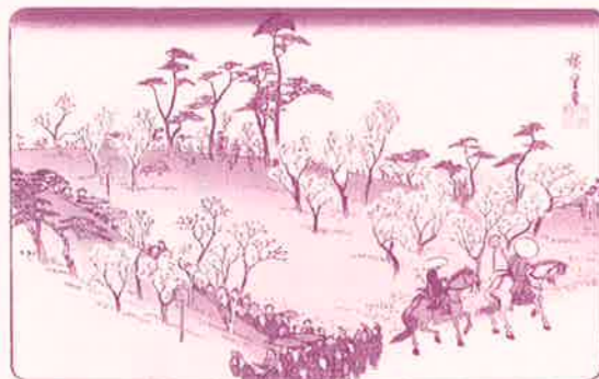
(江戸時代の飛鳥山)